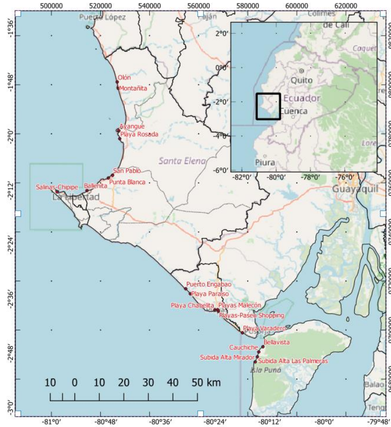
Figura 1. Área de estudio, ubicación de las playas de muestreo.

En diciembre de 2018 se realizó una salida piloto a Playas (General Villamil)