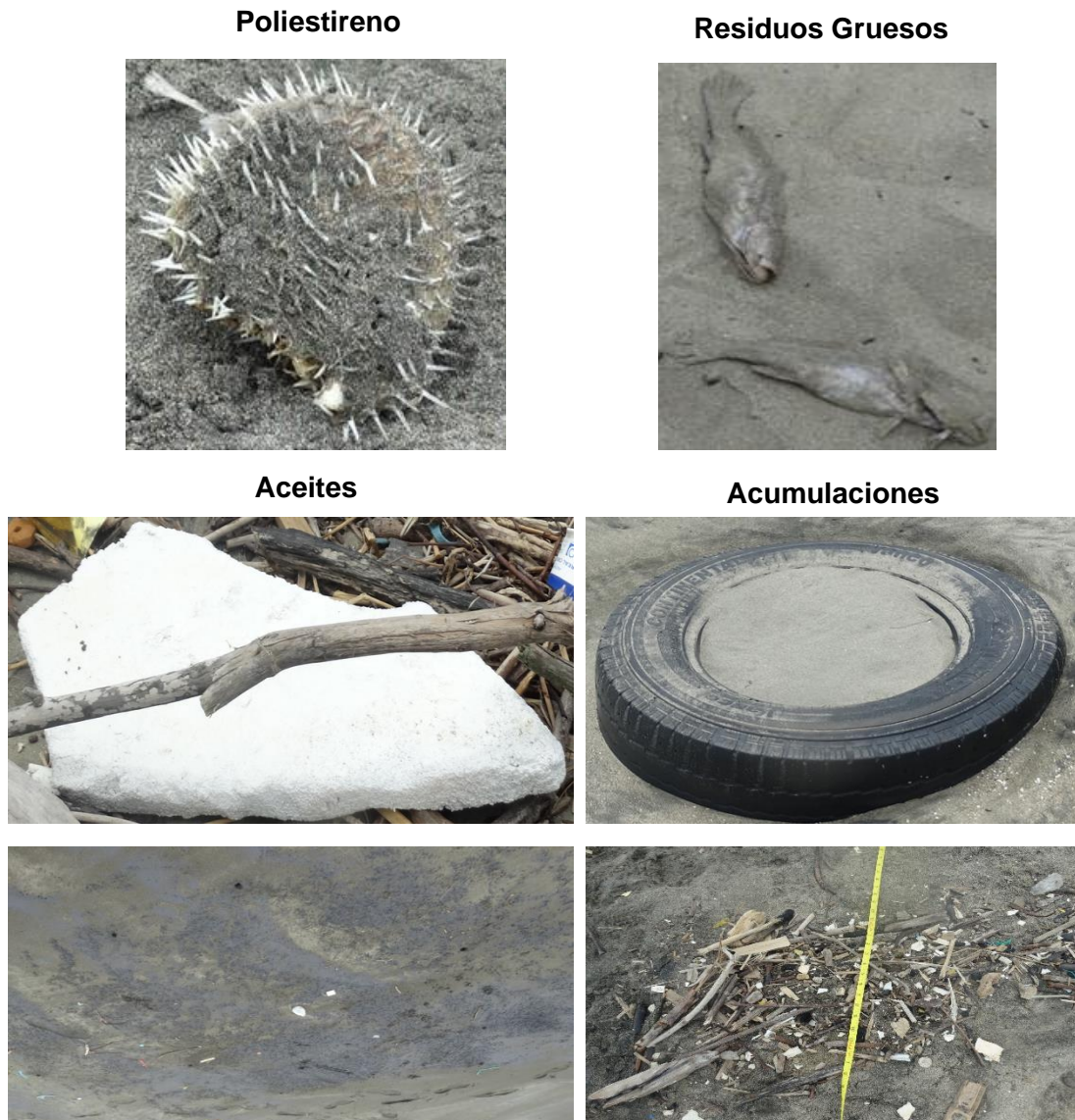
Foto 1. Principales fuentes de residuos presentes en las playas.