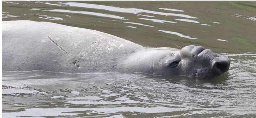
Figura 3. Forma de la probóscide típica de un macho adulto de elefante marino del sur. Nótese las cicatrices en el dorso atrás de la cabeza.

El animal fue forzado a avanzar por el lecho seco del río, las personas hacían ruido, lo tocaban con un palo en diferentes partes del cuerpo, lo agarraban de las aletas posteriores y le echaban agua con las manos sobre la cabeza. El animal reaccionaba enérgicamente persiguiendo a las personas por el agua; con energía, elevaba al aire sus aletas posteriores, para luego levantarse sobre su parte posterior, giraba el torso, emitía vocalizaciones y abría la boca de manera amenazante, entonces descendía lentamente por el cauce. El animal lucía estresado, a ratos parecía estar cansado y le costaba trabajo retomar el camino en busca de la parte más profunda del lecho del río, donde se notaba podía moverse con menos dificultad. En varias ocasiones se observó al animal mojándose el lomo con las aletas pectorales, por lo que se presume se estaba