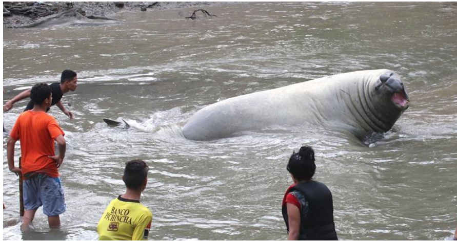
Figura 2. El animal rodeado por personas que lo forzaban a moverse río abajo.